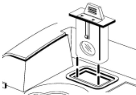
图 3 将过滤装置插入小室